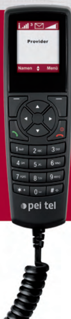
Beispielabbildung: Handapparat HA58